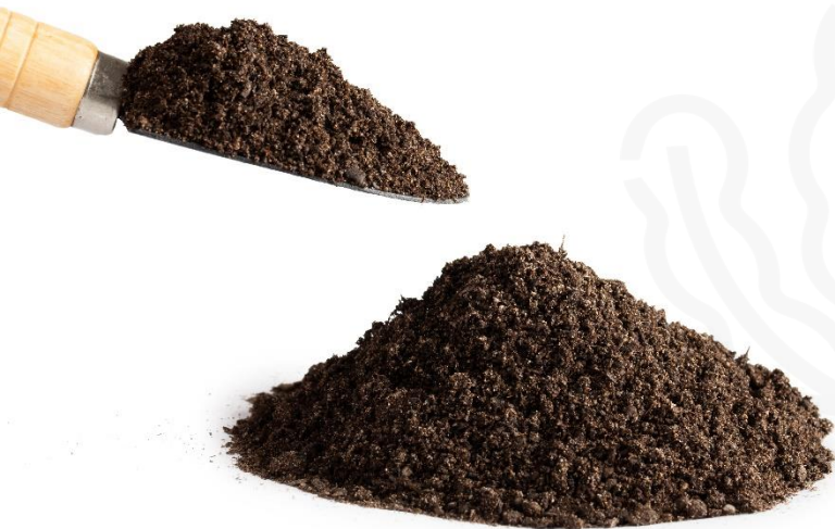
Bokashi de algas rojas

FICOSTERRA nace el seno de la bioeconomía circular: reutiliza algas marinas empleadas para la fabricación de Agar-Agar para convertirlas en un fertilizante de uso en agricultura, jardinería y césped deportivo.